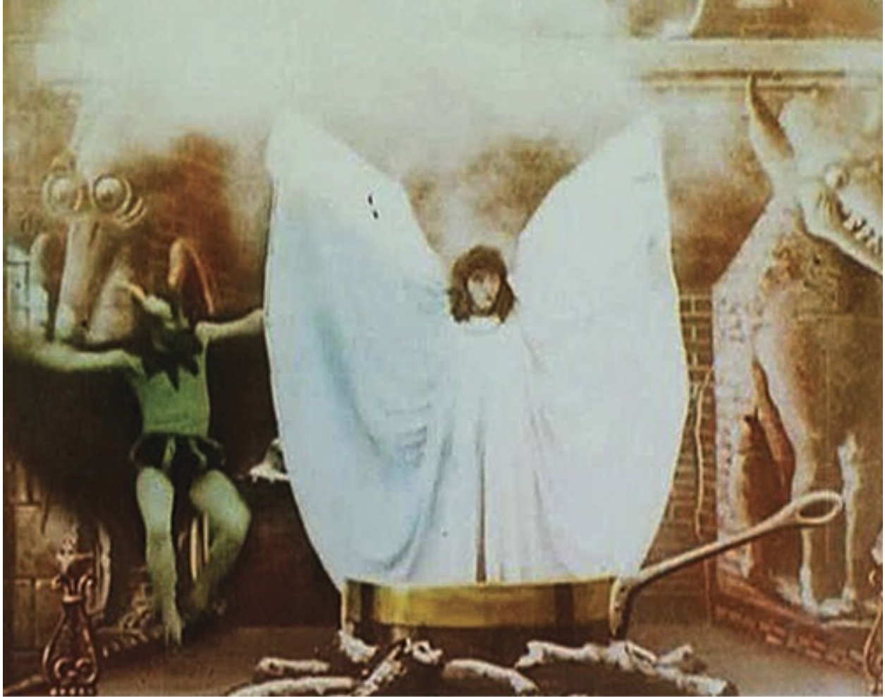
LE DANSE DU FEU / THE PILLAR OF FIRE (1899)